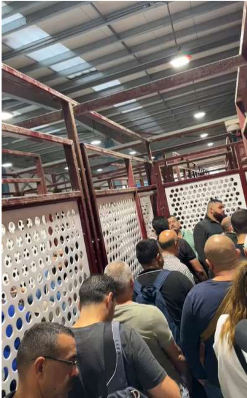
כניסת הפועלים והתלמידים לעמדת הבידוק בטרמינל, 24.10.2023