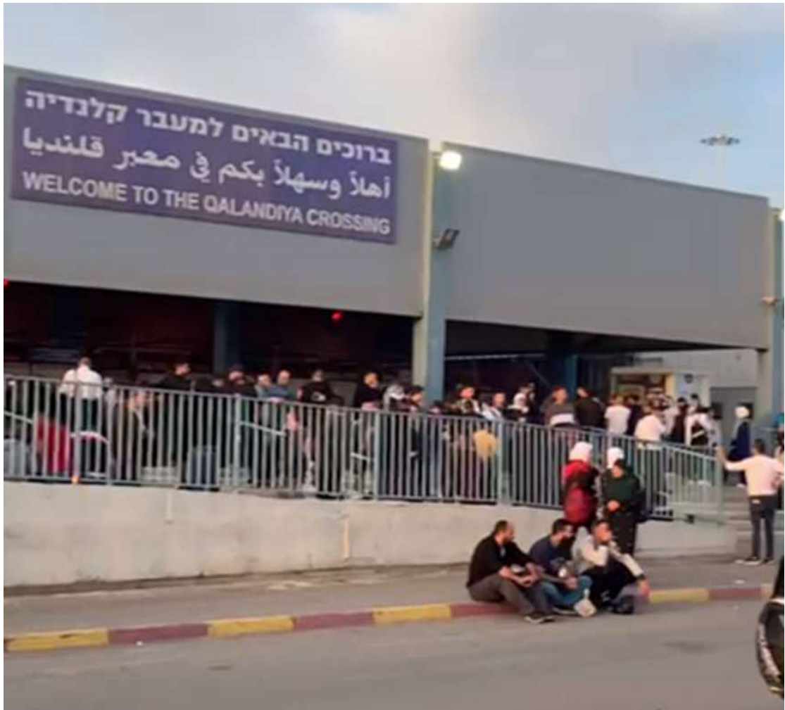
צפיפות במעבר הולכי הרגל במחסום, בהמתנה לבידוק 29.10.2023