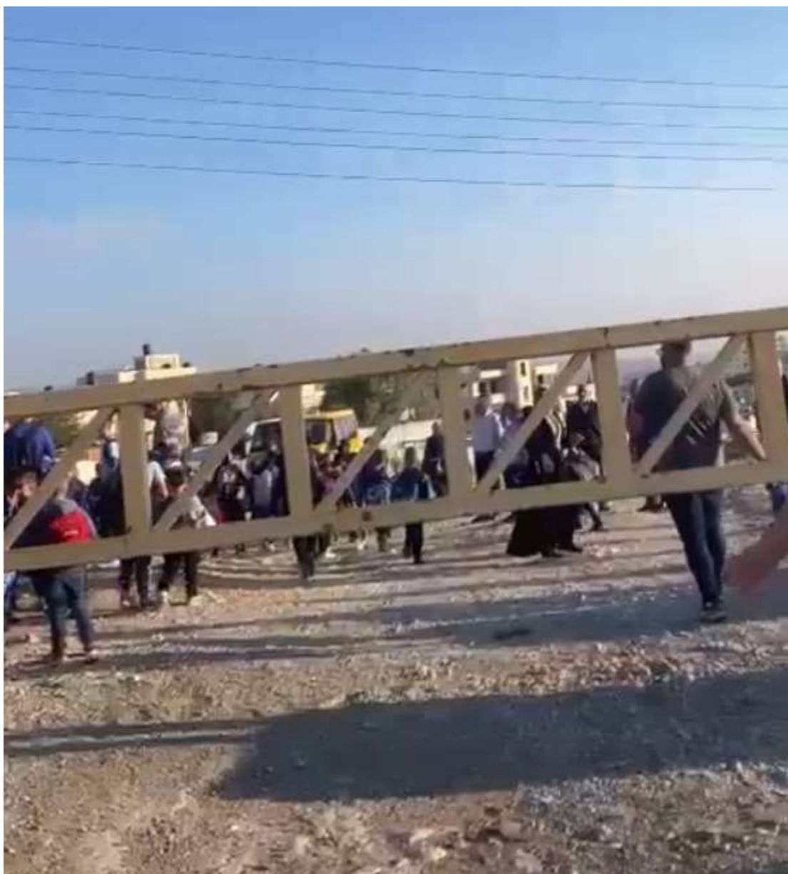
השער הסוגר את הכביש למסלול חיזמה, נפתח ונסגר ללא התראה, 26.10.2023