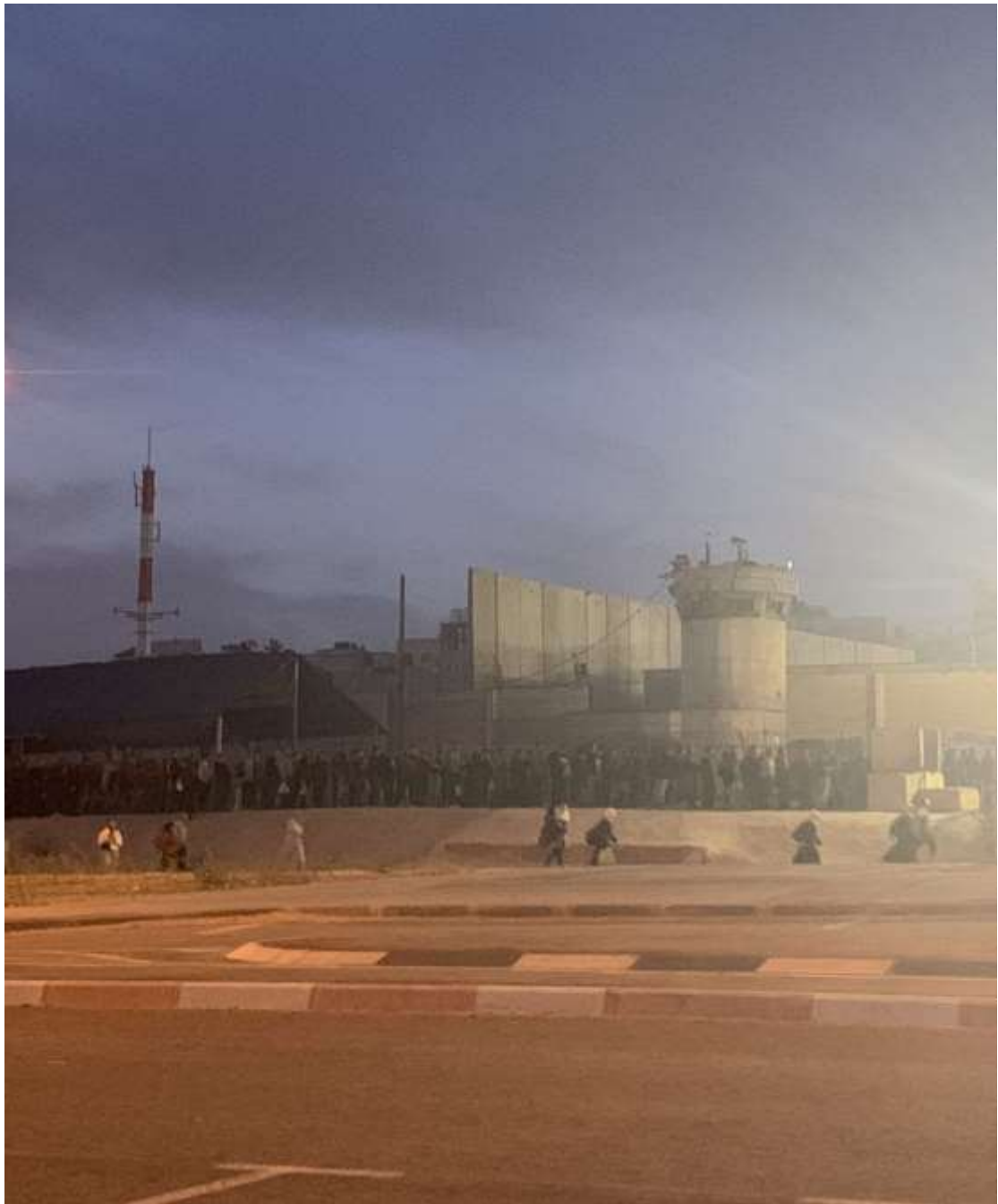
תור לכניסה למעבר הולכי הרגל בטרמינל, שש בבוקר, 24.10.2023