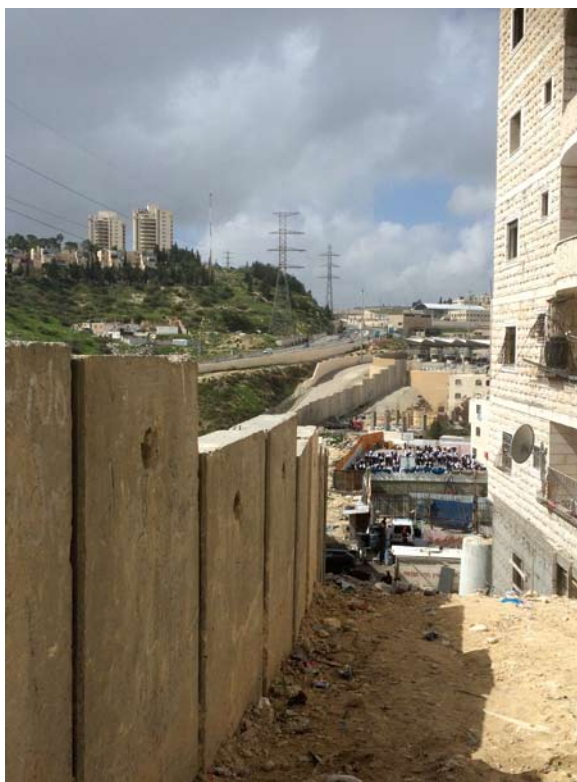
ראס שחאדה על רקע הגבעה הצרפתית

רשויות השלטון האחרות מעודכנות במידה דומה. בשנת 2008, במהלך דיון בעתירה לבג"צ של ועדי שכונות ראס חמיס, דחיית א-סלאם וענאתה ואחרים, העריכו השופטים כי באזור מתגוררים: "למעלה מ-20,000 פלסטינים שהם תושבי קבע של מדינת ישראל ובין 2,000 ל-10,000 פלסטינים תושבי הגדה". 65 באוקטובר 2007 העריך המנהל האזרחי כי בשני האזורים שמעבר לגדר ההפרדה: "מתגוררים כ-55,000 תושבים לא יהודים, מרביתם תושבי מדינת ישראל". 66 בשנת 2006 העריך מכון ירושלים לחקר ישראל כי: "כ-65,000 פלסטינים תושבי ירושלים צפויים לעבור מדי יום דרך המעברים לירושלים". 67 בשנת 2012 העריך המנהל הקהילתי "עוטף ירושלים" כי בשכונות שמעבר לגדר ההפרדה מתגוררים כ-60,000 "מחזיקי תעודות זהות ירושלמיות". 68 דוח 'האגודה לזכויות האזרח' משנת 2014 העריך את מספר התושבים בשכונות אלו: "מעל 100,000" וציון כי בכל אחד משני האזורים (דהיינו, כפר עקב-סמיראמיס, ומחנה שועפט וסביבתו) מתגוררים: "בין 60,000 ל-80,000 בני אדם." כלומר, בשני האזורים יחדיו מתגוררים בין 120,000 ל-160,000 בני-אדם. 69