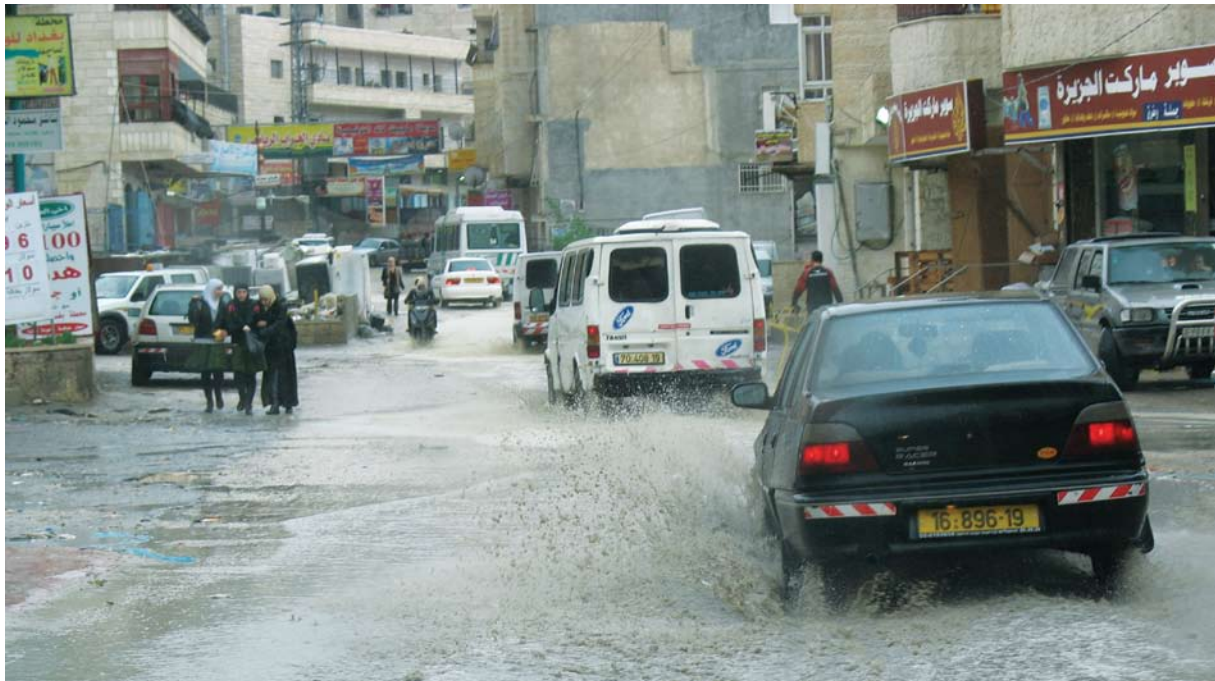
כביש ראשי באזור מחנה הפליטים שועפט

הרשות הפלסטינית היא ששיפצה את כבישי דחיית א-סלאם, לאחר שעיירת ירושלים התעלמה מאין-ספור בקשות לתקנם. איבריהם, תושב הכפר, מורה במקצועו, מספר: "אני בכלל לא מעז לחלום על מגרש משחקים, גינה עם עצים ופרחים וספסלים, אבל כן מצפה לכביש. הישראלים לא עשו למעננו כלום. אז פנינו לרשות הפלסטינית והם סללו כביש. כביש אחד, אבל לפחות כביש אחד בטוח. אולי יום אחד יהיו בו גם פסי האטה."