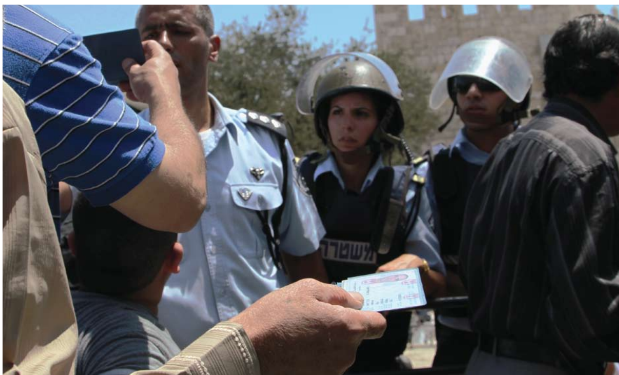
תושבים על תנאי: בדיקת תעודות זהות ליד שער שכם

יום. כניסה חוזרת לעיר, לביקור משפחתי, לעבודה או ללימודים, הותנתה בקבלת היתר. במקביל, נשללו מהם ההטבות הסוציאליות הנלוות למעמד התושבות - ביטוח בריאות וביטוח-לאומי. 35