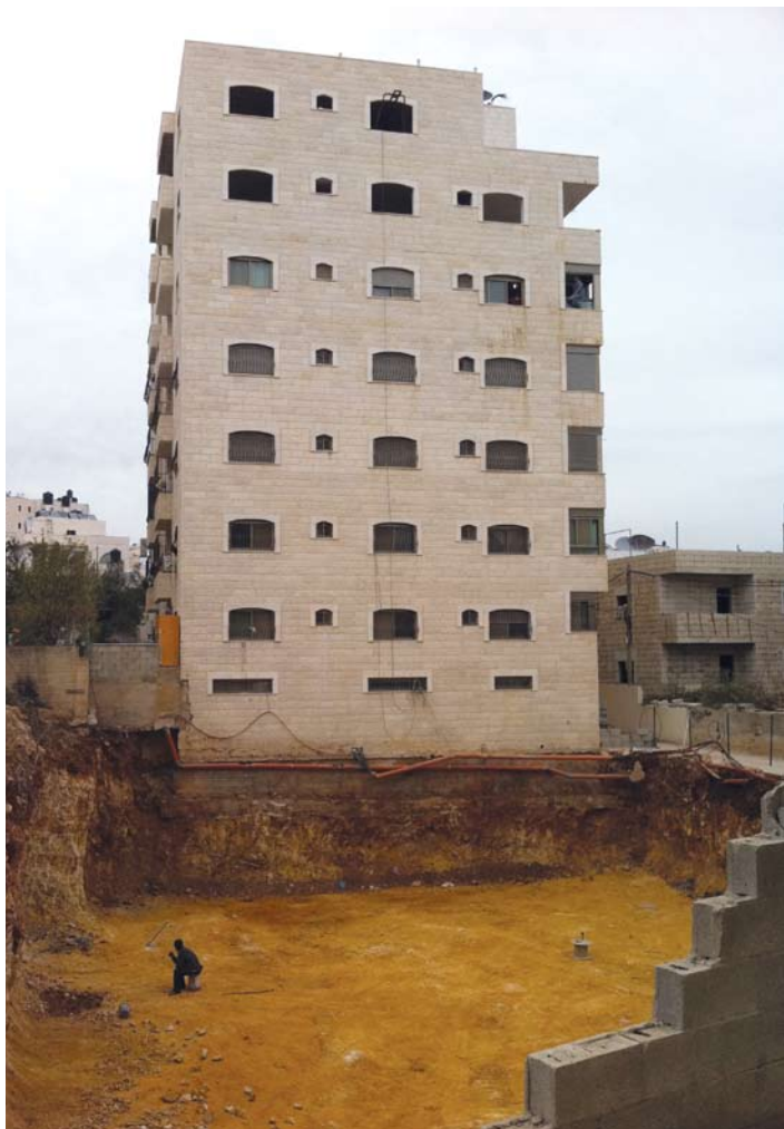
צפיפות בנייה, גרסת כפר עקב: בצמוד ליסודות הבניין החשופים כבר נכרה בור ליסודות בניין נוסף

המשוואה הזו כוללת שלושה מרכיבים רבי-עוצמה: זמינות של קרקעות לא מפוקחות, מצוקת דיור חריפה אל מול ביקוש עצום ואינטרס כלכלי של יזמים וקבלנים. אלא, שנעדר ממנה גורם מכריע אחד: הרגולטור. אף גורם ישראלי - מוניציפאלי או ממשלתי - אינו מנסה לאכוף את הכללים המקובלים בתחום זה: מניעת עבריינות, רישום קרקעות כדין, הוצאת היתרי בנייה ואכיפת סטנדרטים סביבתיים, תכנוניים והנדסיים, בכל האמור בבטיחות ובהקמת תשתיות והקצאת שטחי ציבור התואמים את סוג והיקף הבנייה.