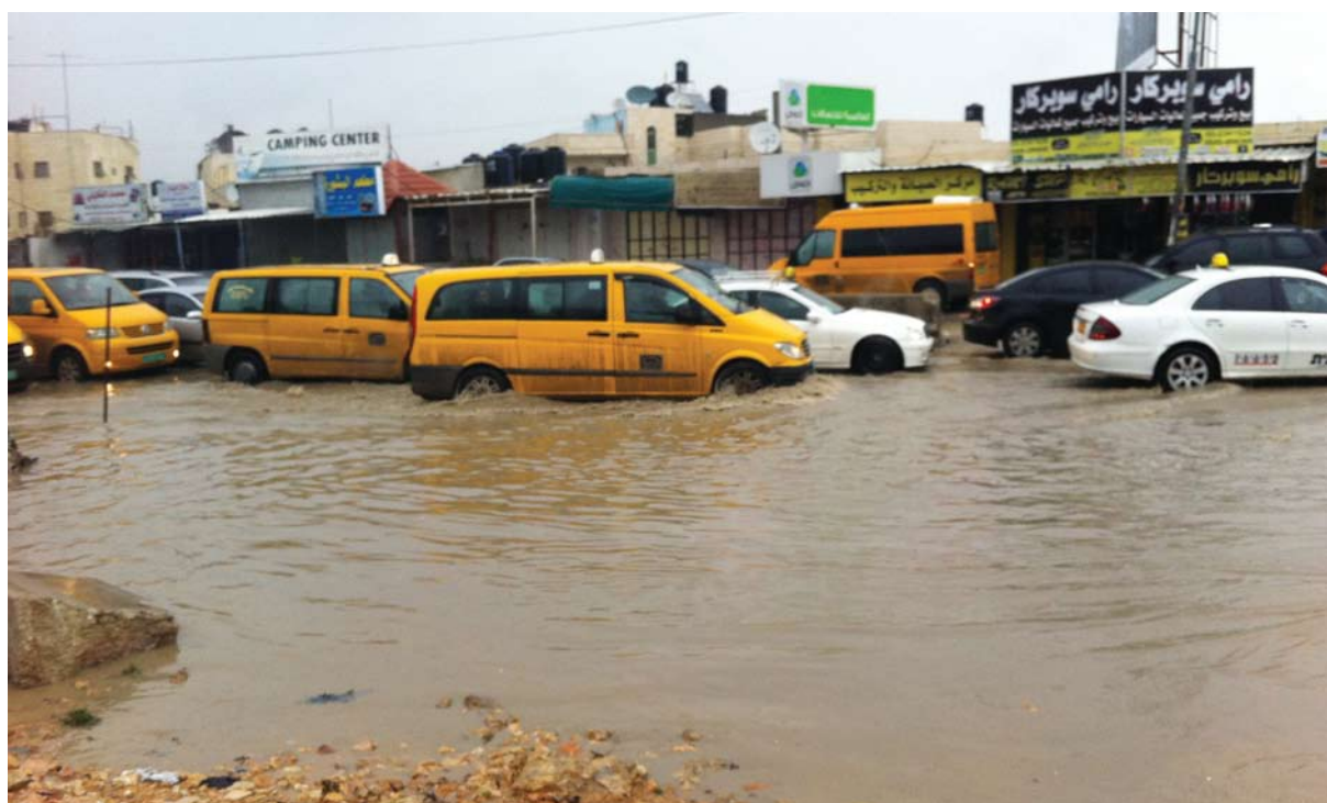
הכביש הראשי לכפר עקב, ליד מחסום קלנדיה

למתן שירותים, שכן היא מפנה את התושבים אל המנהל, אך, לטענתו, אינה מעבירה לו את התקציבים הנדרשים. רוב נציגי הרשויות שהשתתפו בדיון לא הכחישו את הטענות. נציגי שירותי הכבאות טענו שזמן התגובה שלהם כיום ארוך במיוחד וביקשו הקצאת קרקע ומבנה באזור קלנדיה להקמתה של תחנת כיבוי. 87