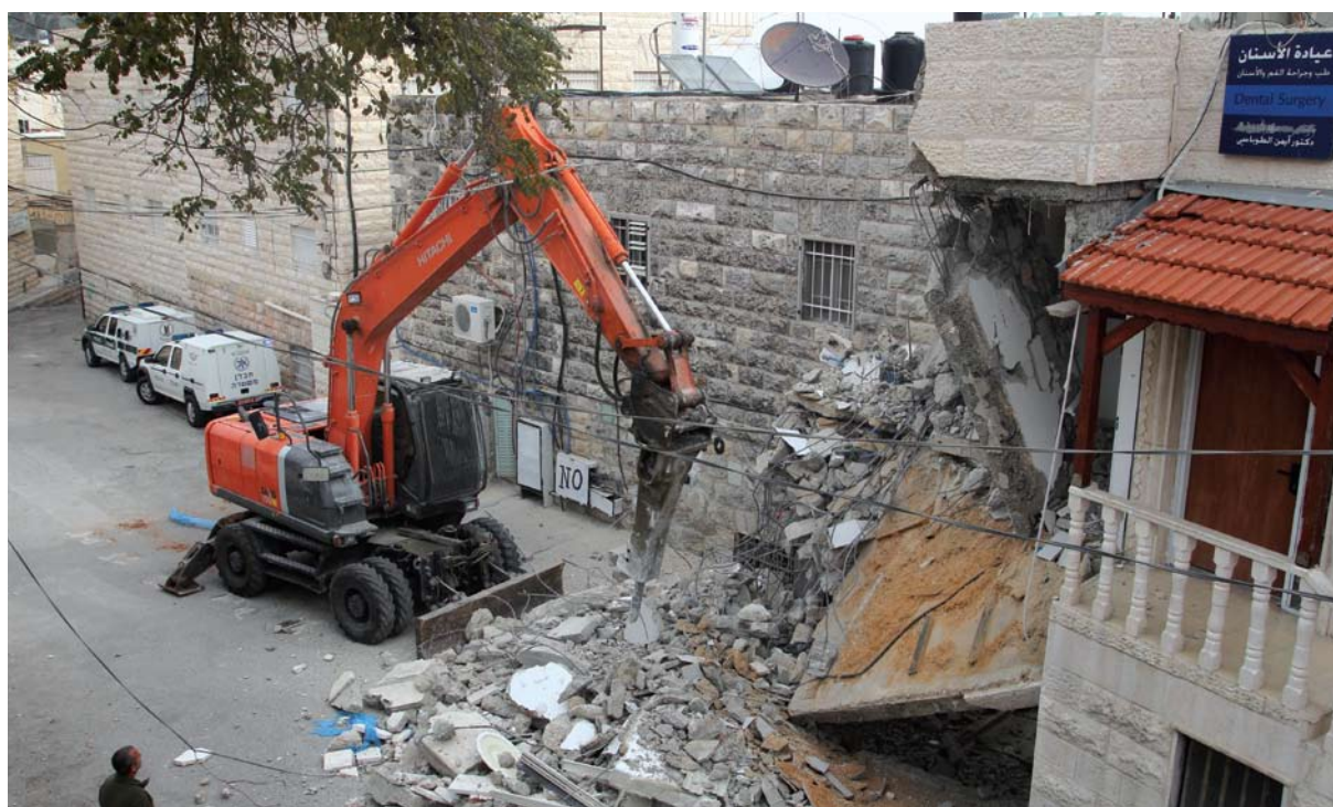
הריסת בית בג'בל מוכבר

לא הקימה ישראל בירושלים המזרחית מערכת ביוב, וכיום חסרים בעיר המזרחית כחמישים ק"מ של קווי ביוב. כעת, מתנה ישראל את אישורן של תכניות בנייה בקיומה של מערכת ביוב ודורשת ממבקשי היתרים לממן בעצמם הקמת מערכות כאלה, הקמה הכרוכה בעלויות גבוהות ביותר. בישראל גופא מוקמים קווי הביוב בידי רשות ציבורית ומימוןם נעשה באמצעות אגרת ביוב. 21 נוסף על כך, מחייבת ישראל מבקשי היתרים בהסדרת מקומות חניה בשיעור המקביל לזה הנדרש על-פי התקנים במערב העיר 22 ומתנה מתן היתרי בנייה לבניינים בני שש קומות בהימצאות כבישי גישה ברוחב שנים-עשר מטרים לפחות. השתת עלויות סלילת הכבישים על מבקשי היתרים הופכת את הפרויקטים האלה, מהיבט כלכלי, לבלתי אפשריים. 23