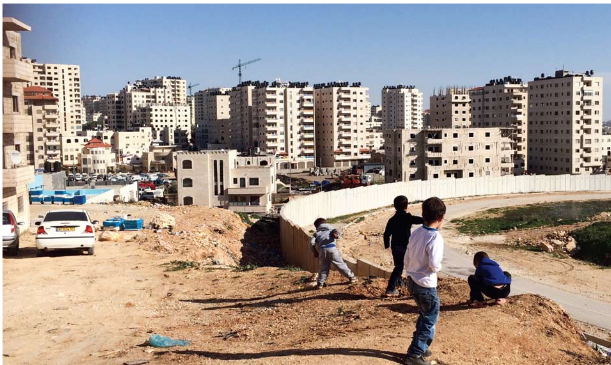
כפר עקב, מבט מגדר ההפרדה

המדיניות הישראלית נועדה להבטיח שליטה טריטוריאלית ישראלית בירושלים המזרחית, תוך הבטחת רוב יהודי משמעותי. שני ביטוייה הראשונים והבולטים היו סיפוח השטח והפקעת שליטתו ממנו לטובת הציבור היהודי ומניעת זכויות פוליטיות מהיחיד ומהקולקטיב הפלסטיני - דהיינו, היעדר מעמד אזרחי מלא והיעדר זכאות לבחור ולהיבחר למוסדות הקובעים את גורלם. 1 מטרתה של מדיניות זו הייתה ביצור החזקה הישראלית על ירושלים בהווה כמו גם בכל הסדר מדיני עתידי; המימוש המעשי שלה היה כרוך במהלכים העומדים בסתירה בולטת לערכים שעליהם הושתתה מדינת ישראל. כחלוף השנים הלכו סתירה זו וביטוייה המעשיים והקצינו, הן מבחינת המגבלות והאפילויות שמהן סובלים התושבים הפלסטיניים, הן מבחינת הפגיעה המחריפה בערכי השלטון והחברה בישראל.