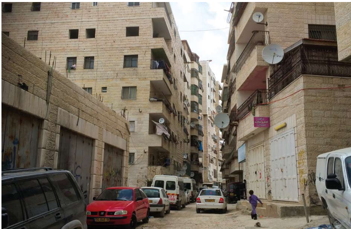
צפיפות בנייה בראס שחאדה

עוד לפני הקמת גדר ההפרדה, פיגרה עיריית ירושלים בשנות-אור בכל הנוגע לטיפול בתשתיות השכונות ובצרכי תושביהן, אך מאז הקמת הגדר ההזנחה כמעט מוחלטת. בכל עבר שולטת עזובה. כבישים, רמזורים, בתי-ספר, גנים, תשתיות חשמל, מים וביוב - כל אלה מצויים במצב ירוד ביותר או שאינם קיימים כלל.