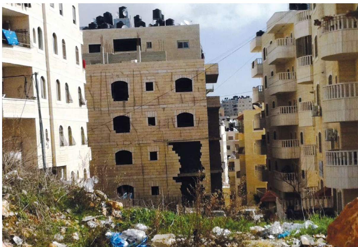
קריסת קיר בבניין בכפר עקב

בעקבות הקמת הגדר, החל תהליך בנייה מואץ בשכונות כפר עקב-סמיראמיס ובמחנה הפליטים שועפט וסביבתו. הבנייה המואצת נועדה לענות על הביקוש העצום לפתרונות דיור זמניים וזולים יחסית בקרב תושבי ירושלים המזרחית, שהתהליכים הפוליטיים והסוציו-אקונומיים דחקו אותם, כמפורט לעיל, משכונות הליבה אל מעבר לגדר. הביקוש העצום לדיור משך לשכונות יזמים וקבלנים שזיהו הזדמנות כלכלית נדירה, אשר קיבלה רוח גבית מן הפרצה הגדולה ברישום הקרקעות ובפיקוח על הבנייה והאכיפה (ראו פרק 1).