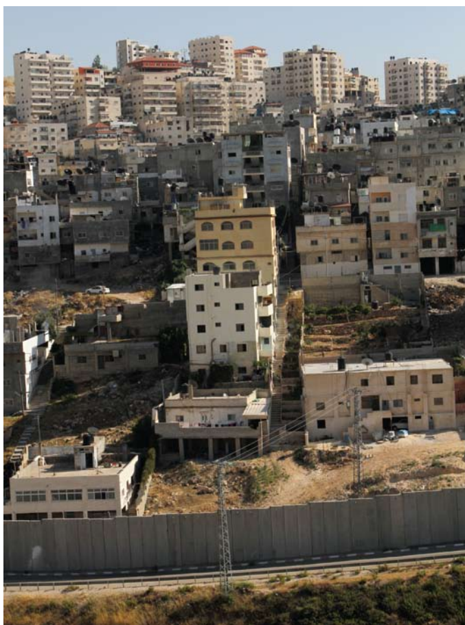
מחנה הפליטים שועפט, ברקע ראס שחאדה