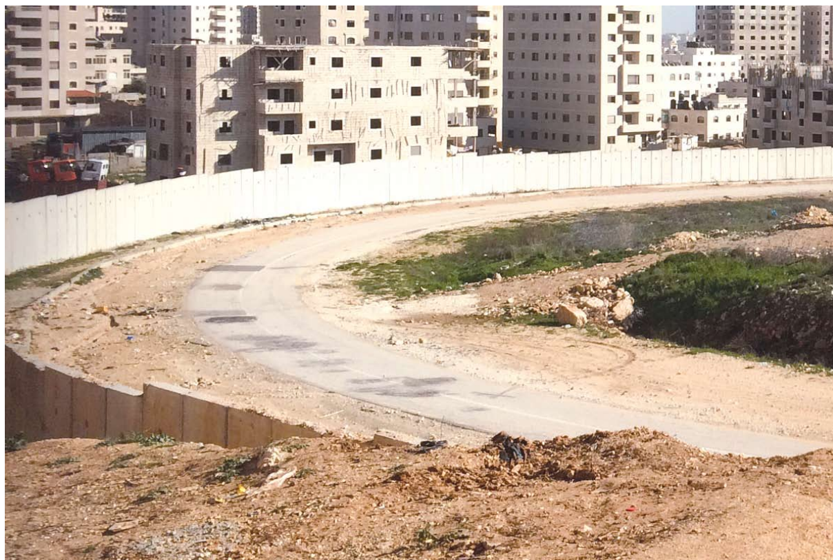
כפר עקב מעבר לגדר ההפרדה

כפי שראינו בפרק א', מאז סיפחה ישראל את ירושלים המזרחית, היא הצהירה שוב ושוב על "אחדות" העיר המערבית והמזרחית. אלא, שאחדות זו התייחסה רק לקרקע ולאדמות של העיר המזרחית, לא לאוכלוסייה הפלסטינית - תושבי העיר שאינם אזרחי ישראל. אלה היו נתונים למכבש לחצים שכלל הזנחה עמוקה של התשתיות הפיזיות והחברתיות, משבר דיור קשה וערעור של מעמד התושבות. בניית הגדר העמיקה את הפיצול והסגרציה של המרחב הפלסטיני הירושלמי, ניתקה שכונות שלמות מעורק החיים העירוני וממקורות מחייתן וזהותן, והיא דוחקת בעקביות את העניים והחלשים שבתושבי ירושלים המזרחית אל שכונות אלו.