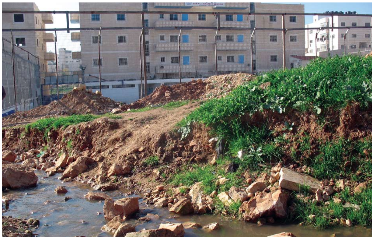
זרימת ביוב ליד בית ספר בכפר עקב

בעוד שירותים חינוכיים נעדרים, ישנן רשויות המגבירות דווקא את פעילותן. מאז 2003, משתמש המוסד לביטוח-לאומי בחברות פרטיות כדי לבצע חקירות בנוגע למעמד התושבות בשכונות שמעבר לגדר. החוקרים מלווים גם בשירותי אבטחה פרטיים. 95 מדובר בתחום בעל רגישות גבוהה ביותר (ראו פרק 1) והחקירות כרוכות בשאלות ובדיקות חודרניות בנוגע