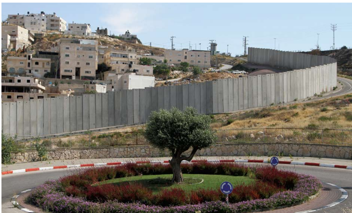
מבט מפסגת זאב המטופחת לעבר ראס חמיס