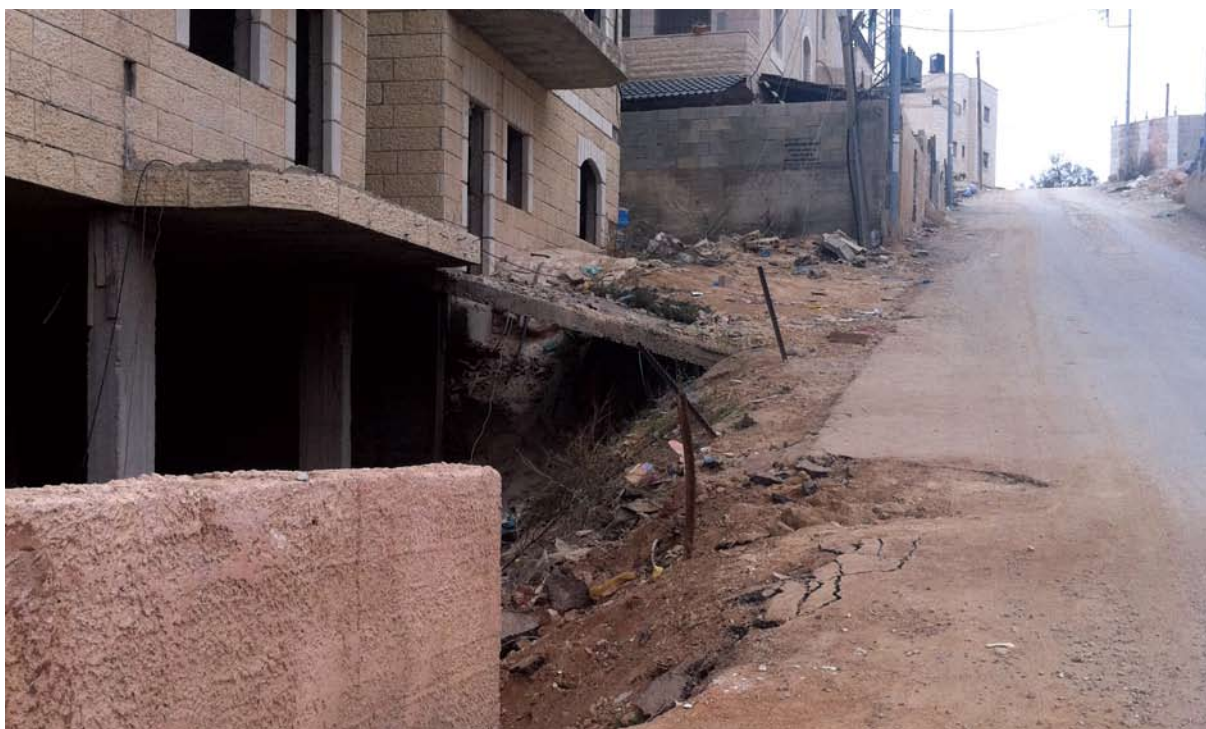
קריסת כביש בכפר עקב

לקראת סוף שנת 2014, פנתה עמותת 'עיר עמים' בשם התושבים, באמצעות עו"ד מועין עודה, למחזיק תיק התחבורה במועצת עיריית ירושלים, לראש עיריית ירושלים וכן למשרד התחבורה, בדרישה להחיל את התכנית גם בשכונות שמעבר לגדר. 84 על כך השיב עו"ד ליבמן, המשנה ליועץ המשפטי לעירייה, כי: "אמנם שטחי השכונות מצויים בתחומה המוניציפאלי של ירושלים, אולם מאז הקמת גדר הביטחון, עת האחריות לביטחון בשכונות אלו נמסר לצה"ל, מתקשה העירייה לספק את שירותיה באזורים אלה... כחלק מכך, העירייה מתקשה גם בביצוע עבודות תשתית, תיקון וסלילת כבישים ומדרכות, שילוט ותמרור בשכונות". 85