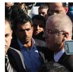
ראש הממשלה הפלסטיני ראמי חמדאללה