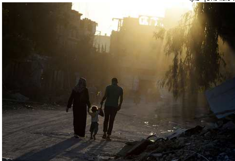
שכונת סג'עייה בעזה במהלך צוק איתן

הפגישה ברמאללה מחדדת את העובדה ששני ערוצים של דיונים בין ישראל לבין הפלסטינים פועלים במקביל. הראשון הוא הערוץ הפומבי אך לא ישיר שמתנהל בקהיר בין המשלחת הישראלית לפלסטינית, שבראשה אמנם עומד בכיר פתח עזאם אל-אחמד, אך גם חמאס שותפה בה. הערוץ השני המקביל הוא זה שדבר פרסומו נחשף כאן.