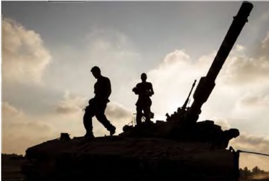
לוחמי צה"ל ממשיכים בפעולה הקרקעית

סוכנות הידיעות הפלסטינית מען דיווחה כי חיל האוויר הפציץ בפעם השנייה את ביתו של בכיר חמאס ניזאר עוודאללה בעזה. לפי הדיווח, בתקיפות ברחבי הרצועה משתתפים כוחות ארטילריה וספינות חיל הים.