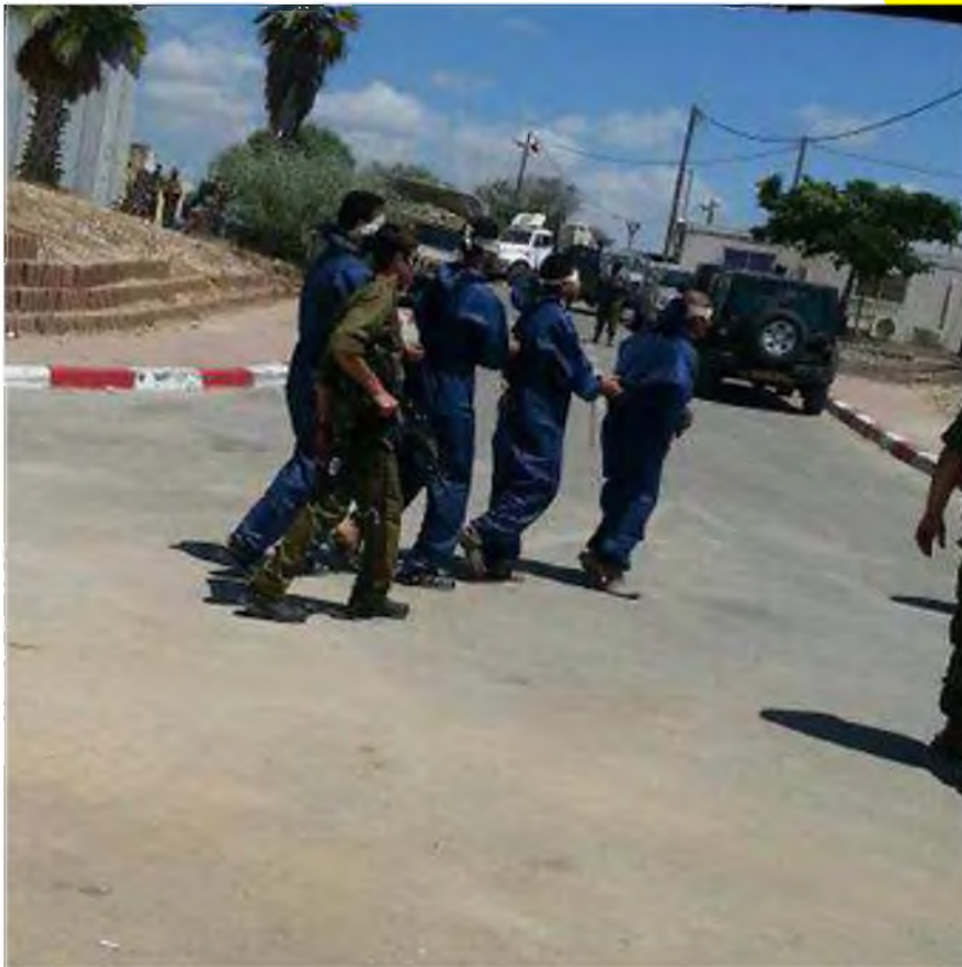
כמה מהעצורים במתקן בישראל

מלבד סוגיית המנהרות והלחימה באנשי חמאס, ללוחמים בעזה יש משימה חשובה נוספת: תפיסת מבוקשים. בימים האחרונים נעצרו כ-20 פעילי טרור בדרגי שטח שונים, ונחקרו על ידי שב"כ במתקנים בישראל. לעת עתה רבים מהנחקרים מניבים למערכת הביטחון מידע שימושי. "הם מספקים את המידע שהם אמורים לספק", אמר גורם צבאי בכיר בימים האחרונים. ynet מפרסם לראשונה תמונה של העזתים שנעצרו במהלך המבצע.