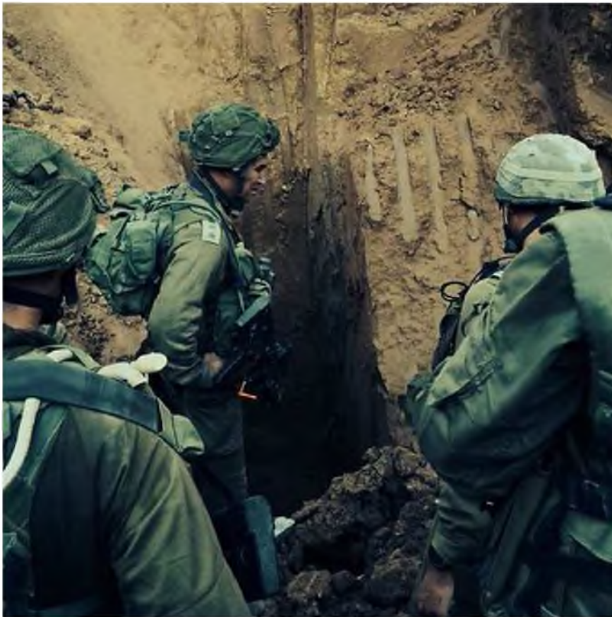
חשיפת מנהרות ברצועת עזה בימים האחרונים