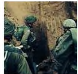
לוחמי צה"ל בתוך הרצועה

מתחילת הלחימה ועד כה נהרגו 29 קציני וחיילי צה"ל. ביממה האחרונה נפצעו שלושה חיילי צה"ל באורח קשה, תשעה חיילים נפצעו באורח בינוני ושמונה חיילים נפצעו באורח קל.