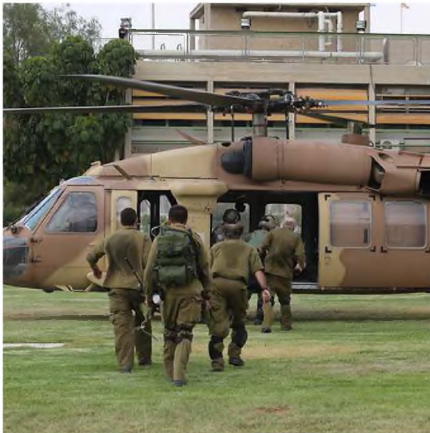
פינוי פצועים לבית החולים סורוקה

במקביל, נמשכה ביממה האחרונה לחימה בגזרות שונות במרכז ובדרום רצועת עזה וצה"ל המשיך לרכז מאמץ בנושא המנהרות. במהלך היממה האחרונה גילו הלוחמים כמה פירים באחת הגזרות, ואתמול פעלו לחבר אותם ולהגיע דרכם לציר מרכזי שמוביל אל מתחת לגבול.